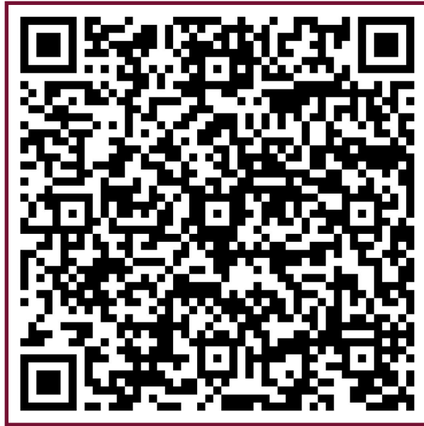
แบบ 56-1 One Report ประจำปี 2566 พร้อมงบการเงินประจำปี 2566