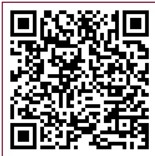
รายงานการประชุมสามัญผู้ถือหุ้นประจำปี 2566